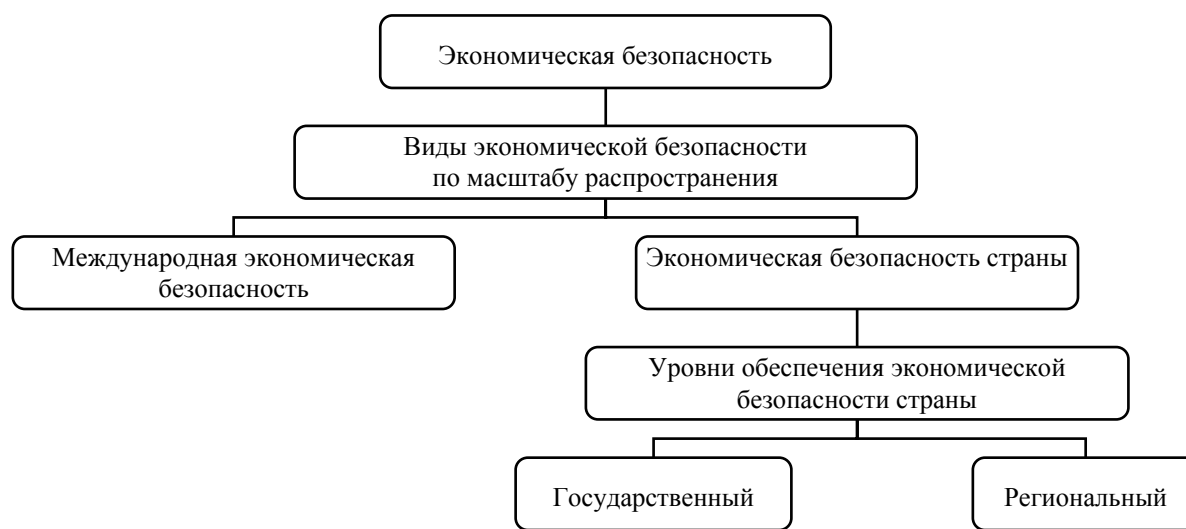
Рис. 4. Виды и уровни обеспечения экономической безопасности

Учитывая тему данной статьи, не будем более подробно раскрывать понятие «международная экономическая безопасность» и перейдем к рассмотрению «экономической безопасности страны».