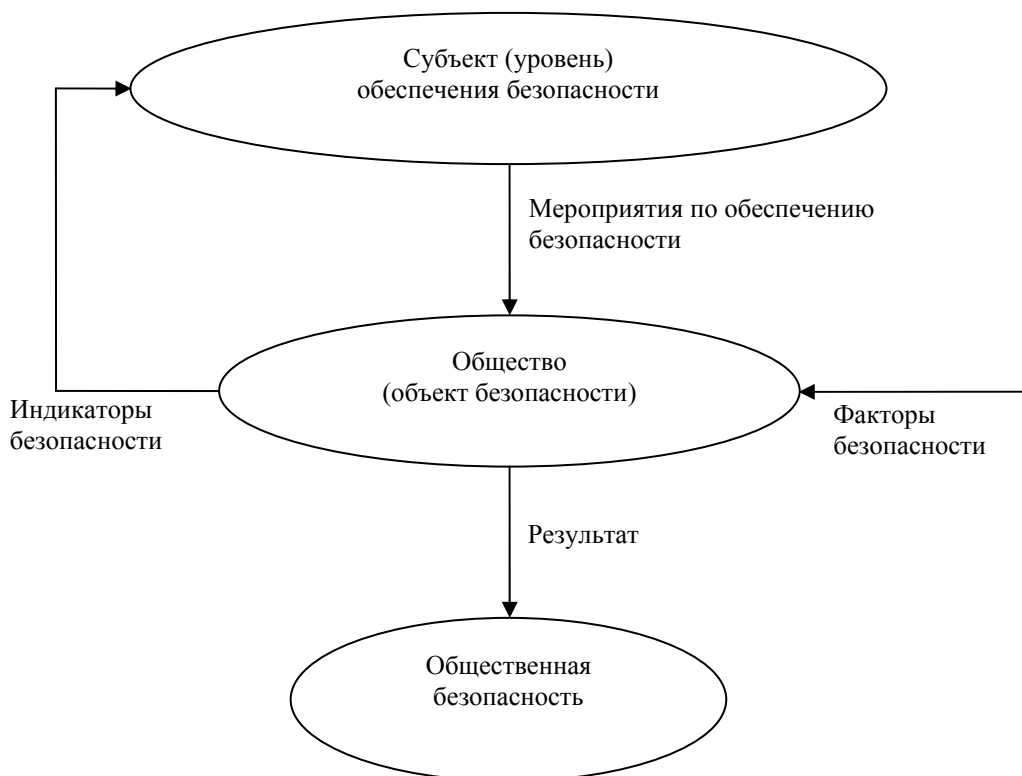
Рис. 2. Схема обеспечения общественной безопасности

Проанализируем существующие научные подходы к рассмотрению общественной жизнедеятельности в сфере экономики как самостоятельного объекта безопасности. Как уже отмечалось, при рассмотрении структуры понятия «безопасность» необходимо выделять в качестве его составляющих наличие объекта, подвергающегося опасности, и наличие факторов, угрожающих безопасности объекта. Кроме того, поскольку процессы, связанные с обеспечением безопасности, по своей сути, являются управленческими, то необходимо также наличие субъекта, обеспечивающего безопасность (рис. 2). При этом обеспечение безопасности одного и того же объекта могут осуществлять разные субъекты, каждый на своем уровне. В этой связи представляется целесообразным вначале выделить уровни обеспечения общественной безопасности, а затем рассмотреть эти уровни применительно к экономической безопасности.