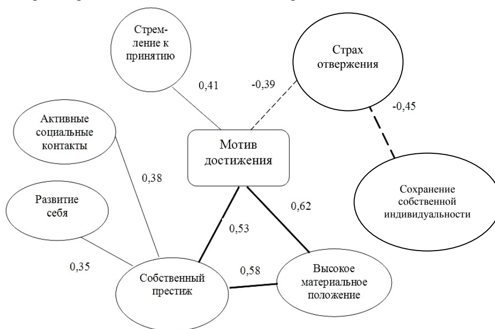
Рис. 3. Корреляционная плеяда связей-показателей мотивационно-ценностной структуры курсантов 5 курса

Также показательным изменением в мотивационно-ценностной структуре для этой группы является возникновение связи между мотивом «Стремления к принятию», ценностью «Активных социальных контактов» и «Мотива достижения». Что могут наглядно демонстрировать активизированные в этот период развития курсантов усилия, направленные на установление благоприятных отношений в различных сферах социального взаимодействия, расширение межличностных связей, реализацию своей социальной роли.