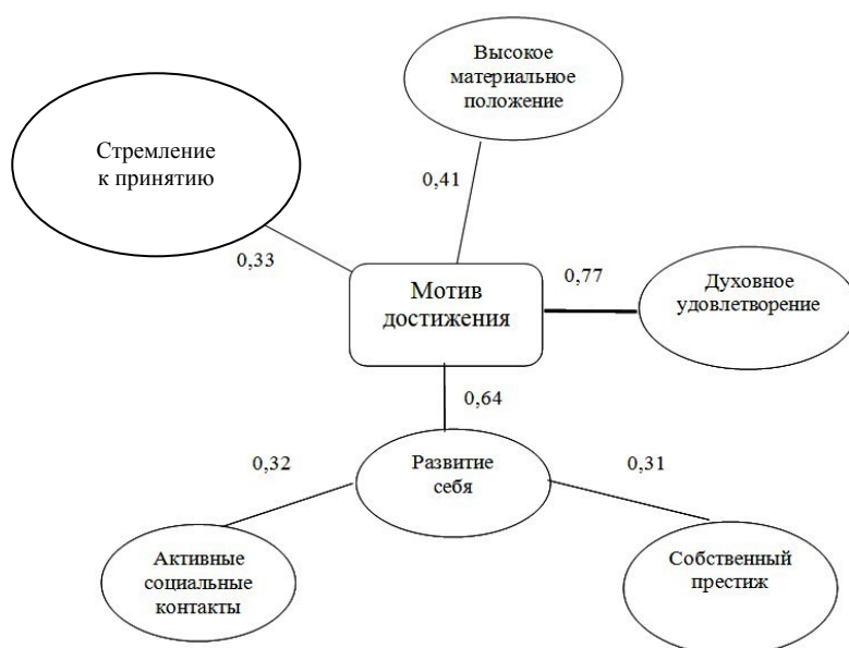
Рис. 1. Корреляционная плеяда связей-показателей мотивационно-ценностной структуры курсантов 1 курса

_____ положительная связь со значимостью коэффициента корреляции на уровне p \leq 0,01 ; _____ положительная связь со значимостью коэффициента корреляции на уровне p \leq 0,05