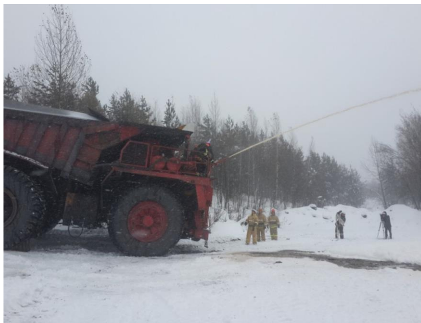
Рис. 3. Приспособленная техника для тушения пожаров на карьерном транспорте на базе автомобиля БелАЗ

В 2016 г. в г. Междуреченске Кемеровской области был опробован первый образец техники, приспособленной для тушения пожаров на базе автосамосвала БелАЗ, с объемом цистерны 60 т, баком для пенообразователя, насосом и стационарным лафетным стволом, представленный на рис. 3. Таким образом, угольный разрез решил вопрос о доставке огнетушащих веществ к месту возможного пожара и возможному снижению времени реагирования [11].