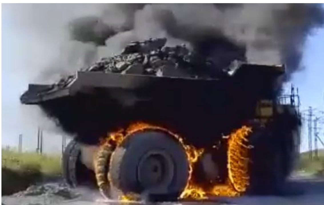
Рис. 2. Горение карьерного автосамосвала

Автоматические системы обнаружения и тушения пожаров не всегда доказывают свою эффективность. Слабым звеном систем пожаротушения является отсутствие вывода сопел над автошинами, являющимися одной из основных составляющих пожарной нагрузки карьерного самосвала. При возгорании автошин и дальнейшем распространении пламени штатные средства пожаротушения, огнетушители не будут эффективны. Помимо этого, работа с огнетушителем вблизи горящих автошин может создать угрозу жизни самого участника тушения пожара при разрыве покрышки. На рис. 2 показано горение автосамосвала с разливом горюче-смазочных материалов и возгоранием автошин [9].