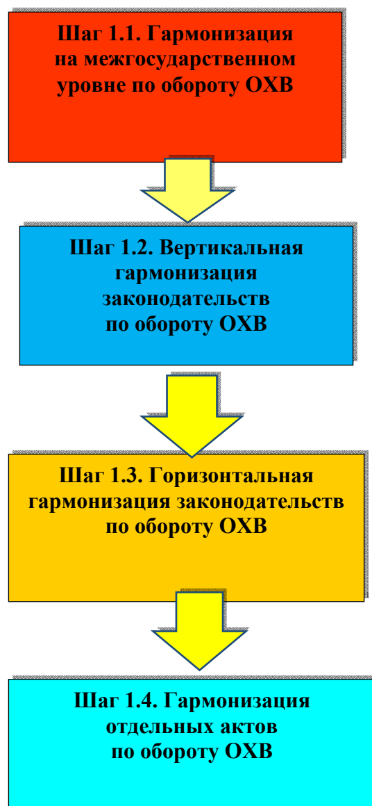
Рис. 2. Алгоритм гармонизации законодательств Российской Федерации и других стран (ЕС) по регулированию оборота ОХВ

Второй уровень гармонизации – вертикальная или иерархическая гармонизация национальных законодательств по проблемам оборота ОХВ.